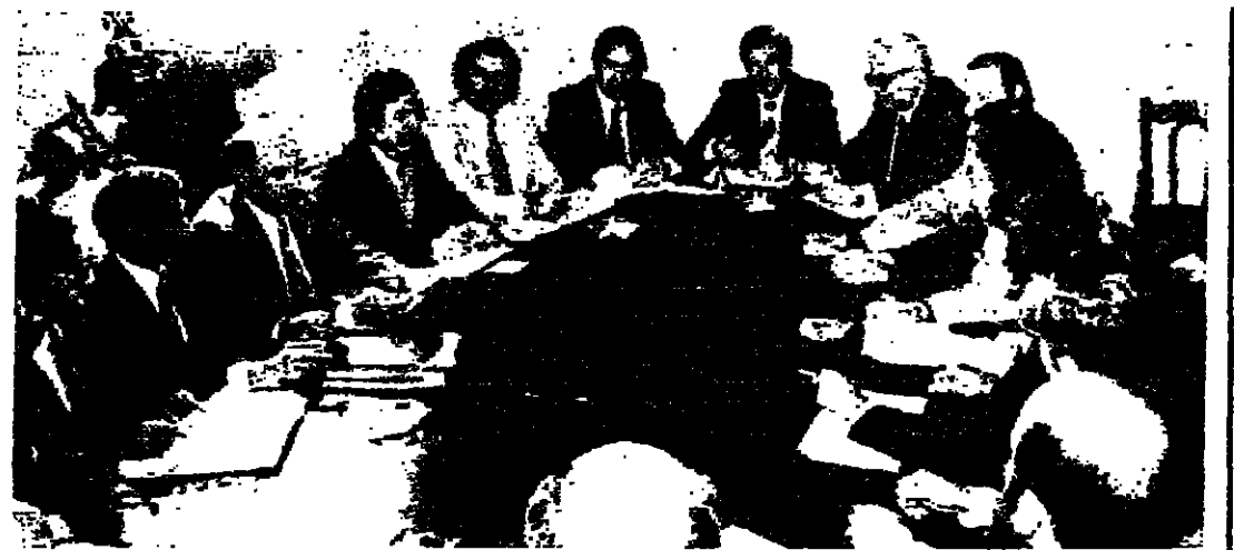
مجلس الاتحاد الجديد جمعيا في مقر الاتحاد البرونزي